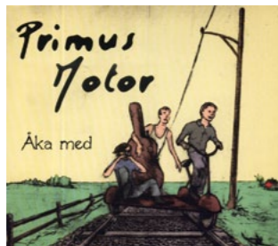
PRIMUS MOTOR «Åka Med»